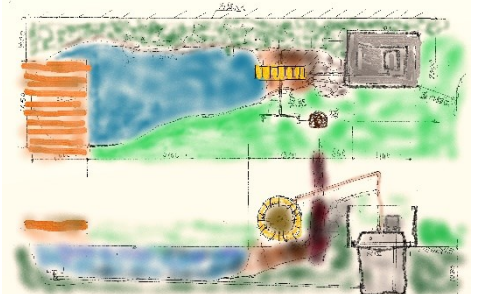
水車が回る「ホタルのすみか」ラフスケッチ (上が平面図、下が断面図) ※但し未定

たもんじ交流農園も認知度が上がるにつれ、野菜づくりをしたい方が多くいらっしゃって空くのを待ってらっている状態です。この農園を訪れてくれる方々とお話しているとやはりますます“まちなか”だからこそコミュニティ農園が必要なこと、「のりしろ」が無限に広がることを実感させられます。たもんじ交流農園は、未来の“令和の御前栽畑”をオールすみだのワクワクで創りあげる。そのプロローグとしても大切な使命があり誇りに感じています。これからもみんなでこの農園で楽しみ合いましょう。