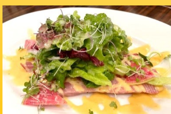
富山氷見より厚切り寒ブリのカルパッチョ 柚子胡椒と白味噌ピネグレット