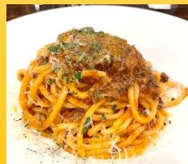
富士幻豚と足利マール牛の極上ポロネーゼ

【総評】 今回、寺島なすのお料理は頂け無かったのですが、注文したお料理全てが想像の上いく大きさ(ブリ)、厚さ(書いていないけどピザの)、旨さ！(全部)で、ナシュランはもちろん大満足の満点「👍👍👍3つ」で、皆さんに超オススメしたいお店でした。たまたまいらした常連さんがお誕生日だったようで、サプライズプリンを振る舞っていて、常連さんも嬉しいびっくりだったようです。