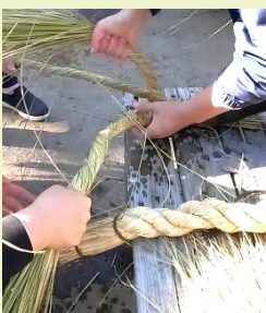
工程③ 2本をねじりながら巻くところ (手前のしめ縄は見本)

12月12日向島百花園で、園内整備をしている親方と弟子の女性の方から、しめ縄作りを教えてくださいました。このワークショップに声をかけていただいた時に、子供のころ祖父がしめ縄を作っていたことを思い出し、ぜひやってみたくらいと思い、