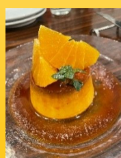
日本一こだわり卵のチーズプリン しまなみドーナツ添え

個人的には facebook で拝見してとても食べたかったかぼちゃプリン(ハロウィンシーズン限定だそうです)を今年秋に食べに行こうと思っています。